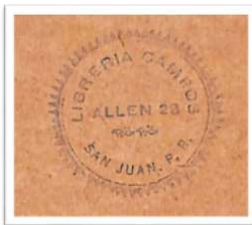
Marca de procedencia. Sello utilizado de la Librería Campos.