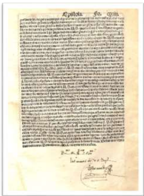
Impreso. Rúbrica de Gonzalo Fernández de Oviedo y Valdés en edición príncipe de Historia general de las indias . Sevilla: Juan Cromberger, 1535.

Biblioteca Nacional “Mariano Moreno” de la República Argentina