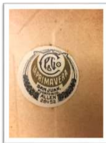
Marca de procedencia. Sello utilizado por la Librería e Imprenta La Primavera