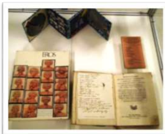
Libro artístico Elvis the Pelvis exhibido con los libros de inspiración.