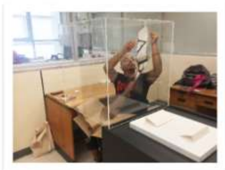
Participación de estudiante en el montaje de la exhibición Marginalia

La exhibición, presentada la colección, presenta los proyectos realizados por estudiantes del curso. Se exhiben junto a los ejemplares de libros antiguos, contemporáneos y raros de la Colección Josefina Del Toro Fulladosa, identificados por ellos como inspiración para sus libros. Como parte de las actividades, los estudiantes participan en el montaje y promoción de la exhibición. Se lleva a cabo una apertura en la que los estudiantes presentan sus libros y hablan sobre el proceso creativo. Los exponentes provienen de la facultad de diversas facultades de la universidad y de las áreas de énfasis del Departamento de Bellas Artes como Fotografía, Dibujo, Pintura y Arte Digital, entre otros.