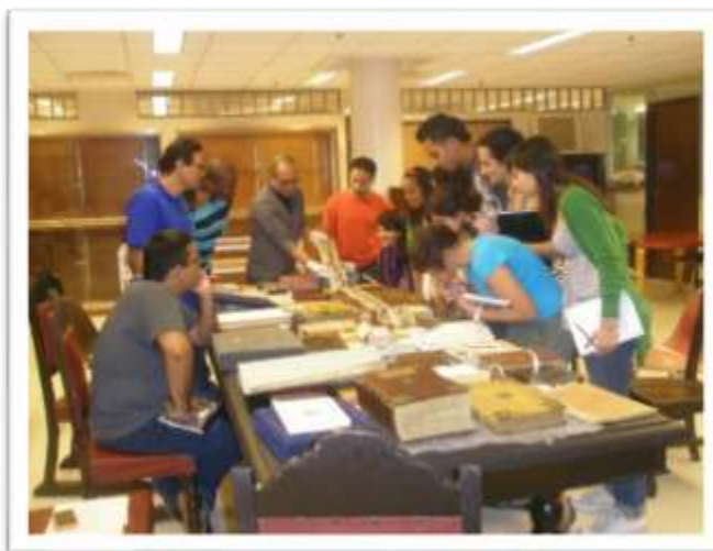
Clase presencial en la Colección Josefina del Toro Fulladosa (Libros Raros). Curso Libro Artístico.